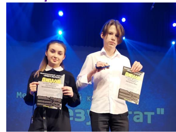
Международный Конкурс «Результат»-конкурс Лауреаты I и II степени 2023г.