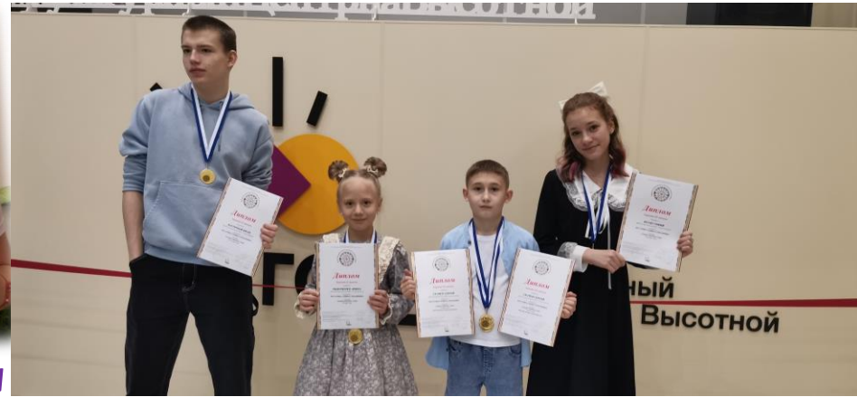
Международный конкурс «Планета талантов» г. Красноярск 2023-2024 г.г.