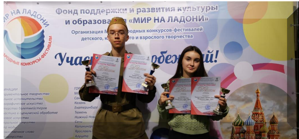
Международный конкурс фестиваль «Таланты России» Лауреаты I степени г Москва 2023г.