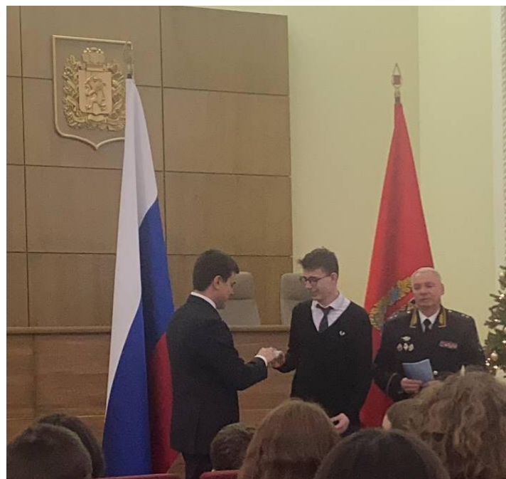
Вручение паспорта губернатором Красноярского края Котюковым М.М.