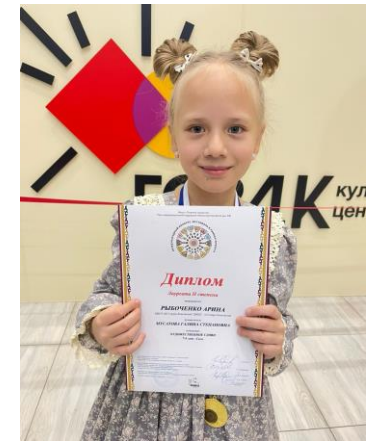
Лауреат II степени Международного конкурса «Планета Талантов» г. Красноярск 2024 г.