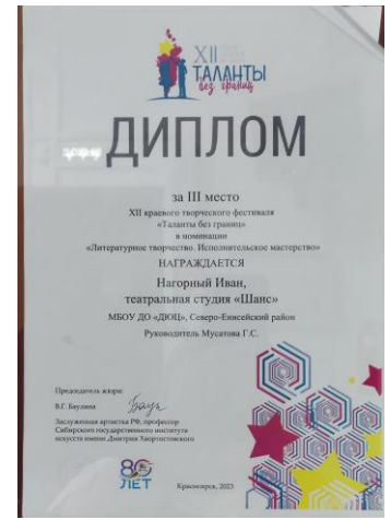
Диплом III степени краевого этапа конкурса «Таланты без границ» 2023 г.