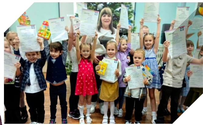
Лауреаты муниципального конкурса по художественному чтению «Слово не воробей» 2024 г.