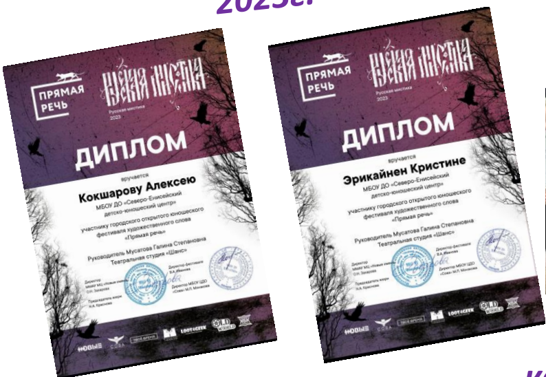
Участники Краевого конкурса чтецов «Прямая речь» 2023г.