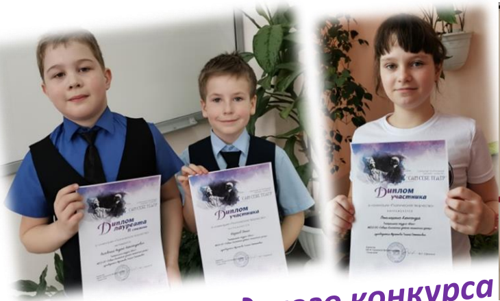
Призёры городского конкурса «Сам себе артист» г.Дивногорск 2023г.